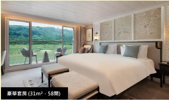
豪華套房 (31m 2 · 58間)