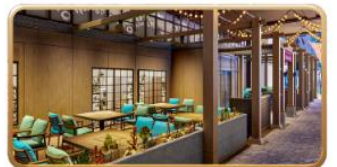
Mike & Sulley's