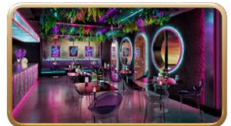
Bewitching Boba & Brews