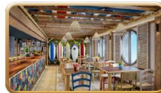
Stitch's 'Ohana Grill