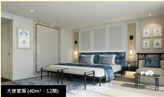
大使套房 (40m 2 · 12間)

客房內附膠囊咖啡機 遊輪全天茶水小吃 客房內甄選飲用水 陸地觀光不限量瓶裝水 景區內 接駁車 或 小交通 遊輪專屬解說服務 陸地觀光專屬導覽服務 陸域觀光 VOX 講解接收器 特邀專家主題講座 最高50萬保額國內旅遊意外險