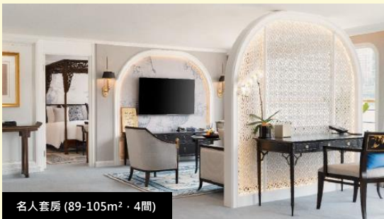
名人套房 (89-105m 2 · 4間)

正餐期間指定品牌進口紅白酒 大使套房陸地觀光獨立成團 大使套房專屬管家服務 航行日每日水果盤 參觀船長室活動 登船城市單程接機/站服務 (1次, 可指定日期, 需預約)