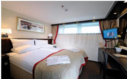
豪華客房 Deluxe Stateroom

房種：D, E (Level 1 – Indigo Deck) 面積：172 sq. ft.