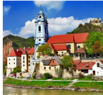
瓦豪河谷 Wachau Valley