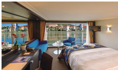
全景套房 Panorama Suite

房種：D, E (Level 1 – Indigo Deck) 面積：172 sq. ft.