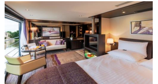
皇家套房 Royal Suite

房種：B, A (Level 2 – Sapphire Deck) P (Level 3 – Royal Deck) 面積：200 sq. ft.