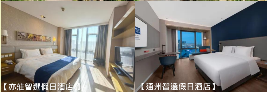
【亦莊智選假日酒店】