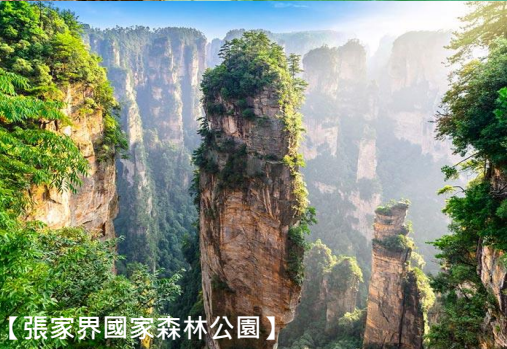
【張家界國家森林公園】