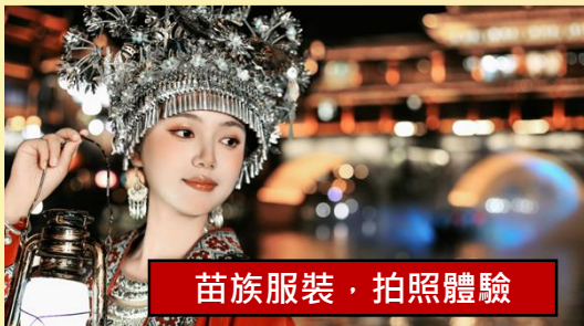
苗族服裝, 拍照體驗