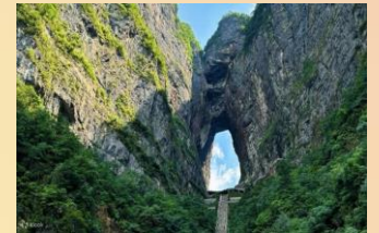
【天門山國家森林公園】