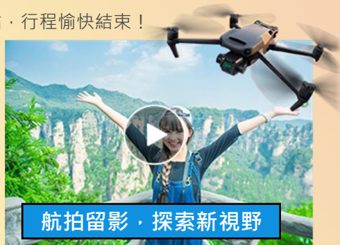
航拍留影, 探索新視野