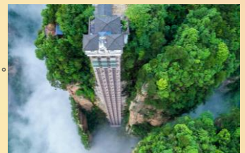
【張家界國家森林公園】

Day 04 張家界國家森林地質公園 > (*自費項目：天子山索道 ¥72) 天子山景區 > 乘環保車遊覽袁家界核心景區(*自費項目：百龍天梯下山 ¥65) > 金鞭溪