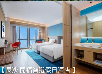
【長沙 開福智選假日酒店】