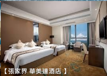
【張家界 華美達酒店】