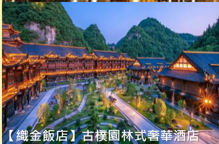
【織金飯店】古樸園林式奢華酒店