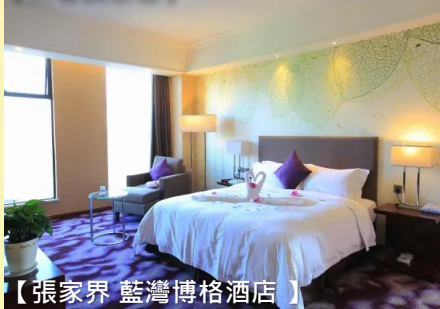
【張家界 藍灣博格酒店】