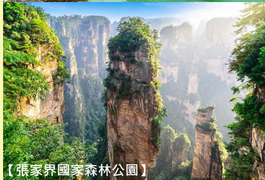
【張家界國家森林公園】