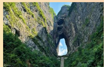
【天門山國家森林公園】

『天門山』：天門山國家森林公園因自然奇觀“天門洞”而得名，天門洞是巨大的穿山溶洞，經常霧氣瀰漫，走上到達天門洞的台階有種登上天庭的感覺。