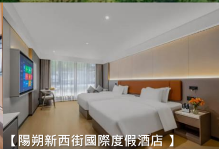
【陽朔新西街國際度假酒店】