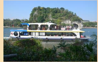
【乘船漫遊「一江四湖」】

【象鼻山】：位於桂林市內桃花江與漓江匯流處，被人們稱為桂林山水的象徵。它形似一頭鼻子伸進漓江飲水的巨像，構成「象山水月」奇景。