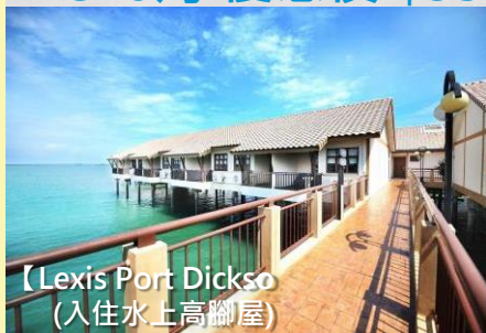
【Lexis Port Dickson (入住水上高腳屋)】