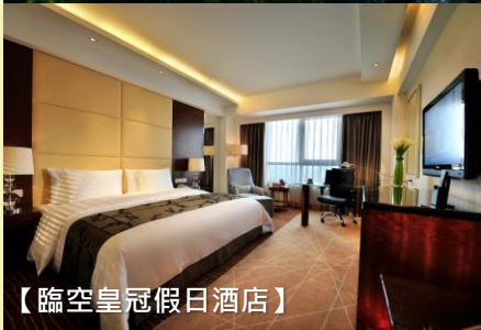
【臨空皇冠假日酒店】