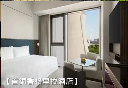
【首鋼香格里拉酒店】