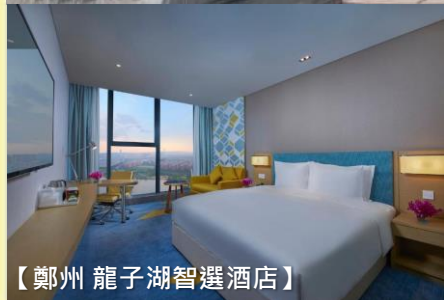
【鄭州 龍子湖智選酒店】