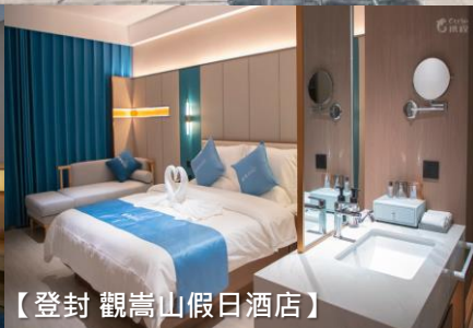
【登封 觀嵩山假日酒店】