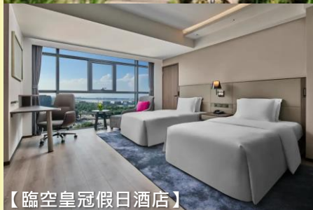
【臨空皇冠假日酒店】