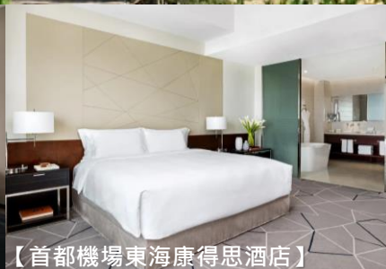
【首都機場東海康得思酒店】