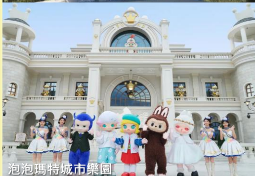
泡泡瑪特城市樂園