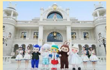
【泡泡瑪特城市樂園】