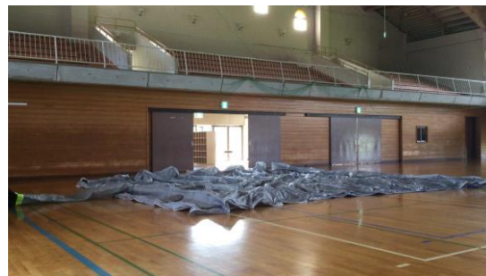
本体を広げ、送風約2分30秒で展張