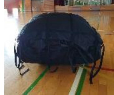
設置前折り畳みの状態