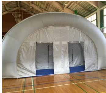
正面・入り口幕を巻き上げ