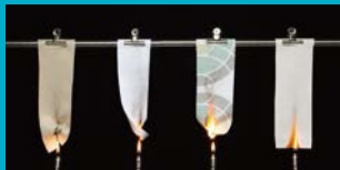
エースツイン® ホリエステル 100% ホリエステル/綿 100% ホリエステル/綿 100%