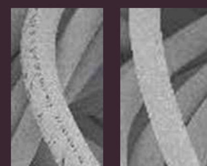
単糸の太部と細部

ポリエステルでありながら、ウールのような糸構造で作り上げることで、ふくらみや反撥性が生まれ、製品に立体感や高級感をもたらします。また、単糸の太部と細部を組み合わせたランダムなコイルが、ナチュラル感を生み出します。