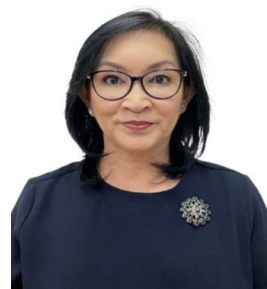
Hormat kami, PT Indodana Multi Finance

Keberlanjutan bagi kami bukan hanya tujuan, melainkan strategi utama dalam menciptakan nilai jangka panjang. Kami berkomitmen terus memperluas dampak positif bagi seluruh pemangku kepentingan demi masa depan yang inklusif dan berkelanjutan.