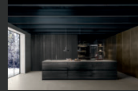
12 FLY FLOAT