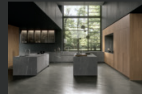
16 TWENTY FLY