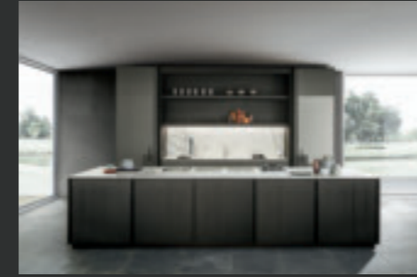
11 FRAME BLADE