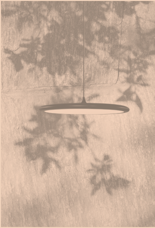
BILANCELLA CODE 512