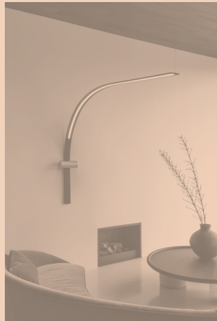
NASTRO CODE 563