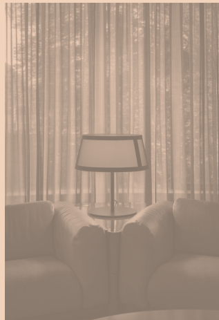
LILLY CODE 558