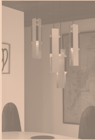
EXCALIBUR CODE 559