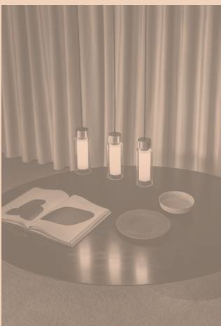
OSMAN CODE 560