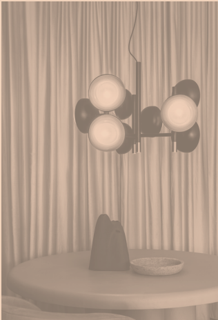
MUSE CODE 554