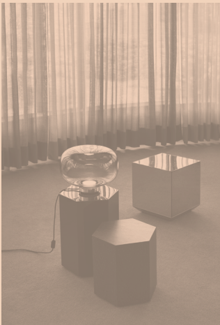
LEGIER CODE 557