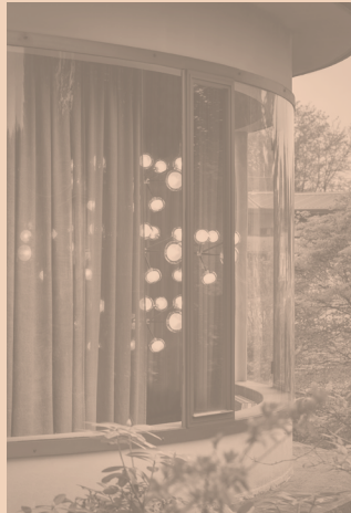
NABILA CODE 552