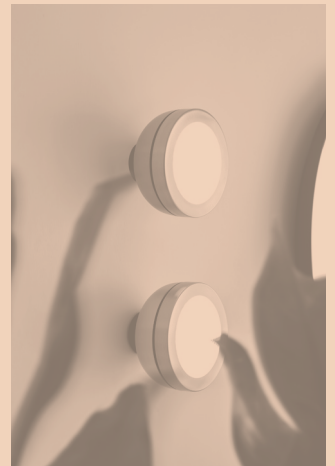
MOLLY CODE 556