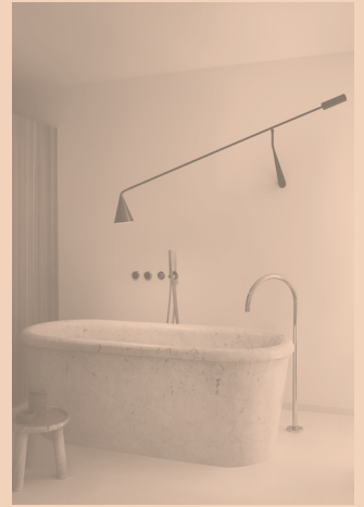
GORDON CODE 561