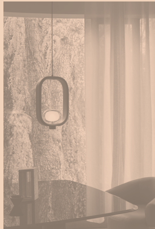
FILIPA CODE 555