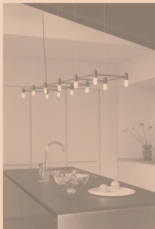
QUADRANTE CODE 505