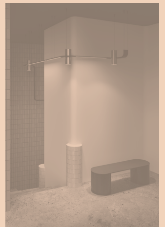
NASTRO SYSTEM CODE 563