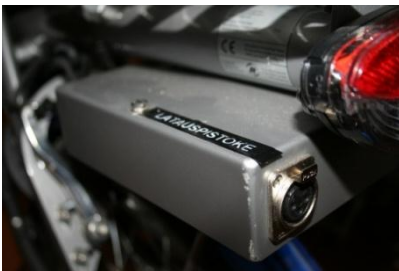
Kuva 11. Apumoottorin lataus Latauspistoke löytyy tarakan alta. Sammuta virta, kytke latausjohto ensin pyörään ja sitten seinään. Akku on täynnä kun vihreä merkkivalo palaa. Irrota johto ensin seinästä ja sitten pyörästä. Pyörän säädöissä tarvittavat työkalut tulevat pyörän mukana. MUISTA palauttaa myös työkalut.

Apumoottoria voi hyödyntää raskaissa paikoissa, kuten ylämäissä ja liikkeellelähdössä. Moottori käynnistyy ainoastaan pyörää polkiessa ja kaasukahvasta kierrettäessä.