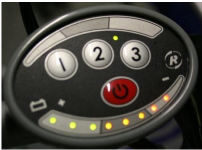
Kuva 10. Varmista että apumoottorin johdot ovat kytketty. Nosta pyörän jalka ylös, vapauta seisontajarru ja kytke virta punaisesta virtakytkimestä. Näytöstä näkee akun varauksen: jos virta on vähissä, vain punaiset valot palavat. Apumoottorissa on kolme vaihdetta, tasaisella vaihteet 1 ja 2 riittävät. Jos moottoria ei käytetä hetkeen, virta katkeaa automaattisesti. HUOM. Tarkista että virta ei ole kytketty, kun pyörää talutetaan tai kun avustettavaa siirretään!

Apumoottoria voi hyödyntää raskaissa paikoissa, kuten ylämäissä ja liikkeellelähdössä. Moottori käynnistyy ainoastaan pyörää polkiessa ja kaasukahvasta kierrettäessä.