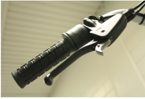
Kuva 6. Lukitse pyörän seisontajarrut painamalla käsijarru pohjaan ja lukitse jarru metallisella nokalla.