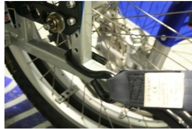
Kuvat 8 ja 9. Vapauta pyörätuolin kiinnitysremmi painamalla pinkkiä vipua ja kiinnitä remmit pyörätuolin runkoon (kaksi takana, yksi edessä) ja kiristä ratasta kääntämällä. Kiinnitä pyörätuolissa istuvan turvavyö.