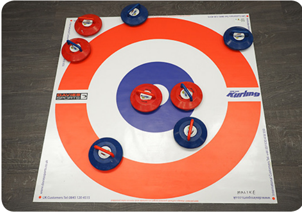
Kuvassa punaiset voittivat erän 2 – 0.