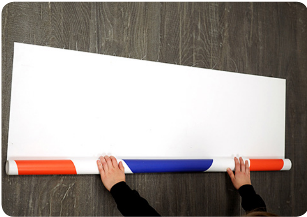
Pelin jälkeen matto käännetään takaisin rullalle kuvapuoli ulospäin.