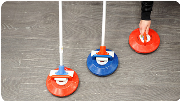
Curling-kiveä voi työntää kädellä tai työntimellä.