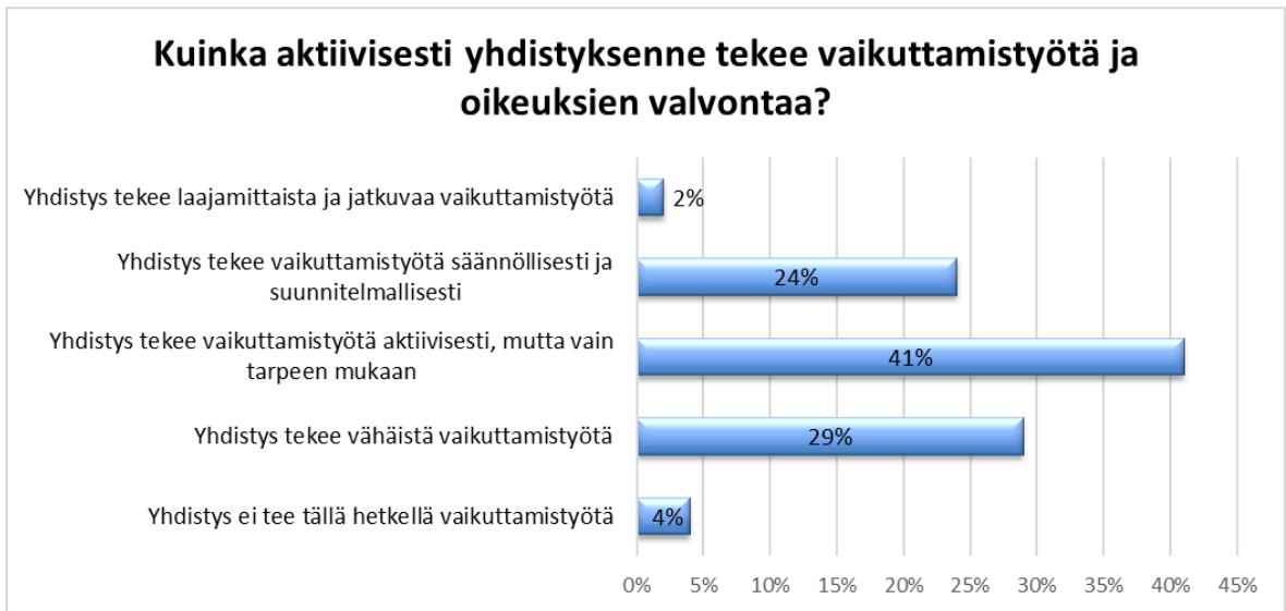
Kuvio 1. Yhdistysten tekemän vaikuttamistyön aktiivisuus

Selvitystyön perusteella voidaan todeta, että Tukiliittoon kuuluu paljon erilaisia yhdistyksiä, joiden nykytila sekä tulevaisuuden näkymät eroavat toisistaan. Osassa yhdistyksissä toiminta on vahvalla pohjalla ja tulevaisuus nähdään valoisana. Osalla taas on haasteita toiminnassa mm. jäsenmäärän vähäisyydestä ja toimijoiden ikääntymisestä johtuen, ja myös tulevaisuus nähdään haasteellisena. Kyselyn mukaan eroa on myös näkemyksissä toiminnan suhteen - aktiiviset yhdistykset näkevät vaikuttamistyön keskeisimmäksi tehtäväksi, kun taas vähän vaikuttamistyötä tekevät yhdistykset näkevät virkistystoiminnan oleelliseksi osaksi yhdistyksen toimintaa. Aineiston perusteella voidaan kuitenkin todeta, että suurimmalla osalla yhdistyksistä on tahtotila tehdä laajempaa vaikuttamistyötä kuin tällä hetkellä on mahdollista.