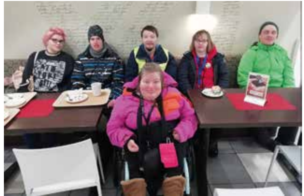
Uuden ryhmän nimi on Ylivieskan Me Itse -ryhmä Aurinkoiset.

Kiitokset pyhäjärveläisille ja tervetuloa joukkoon ylivieskalaiset!