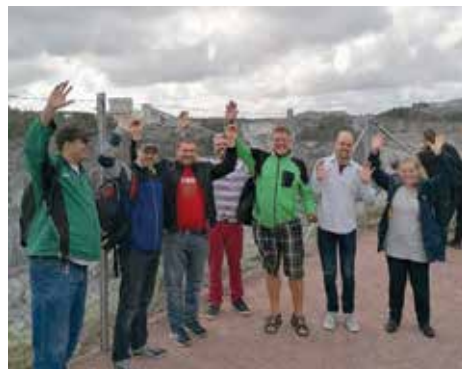
Yhteistyö on voimaa!

Kiertelimme Paraisilla ja kävimme kahvilla. Sovimme, että voisimme pitää Turun ja Paraisten yhteisiä kokouksia. Voisimme myös käydä yhdessä vaikka keilaamassa.