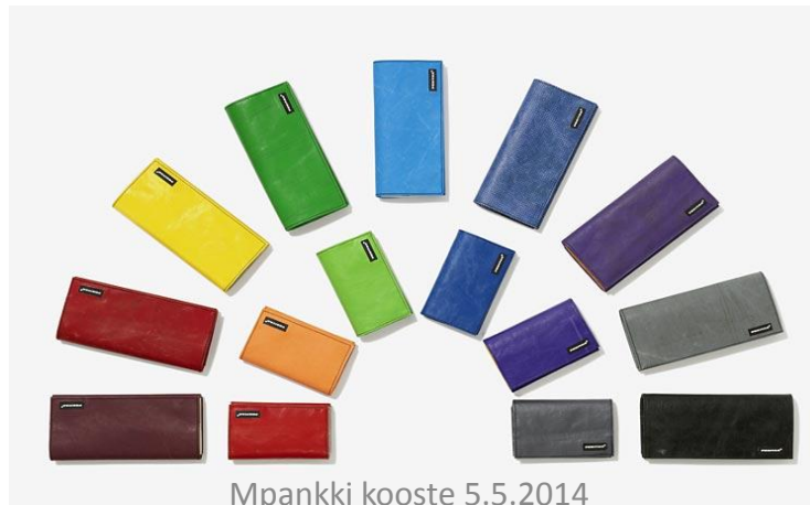
Mpankki kooste 5.5.2014