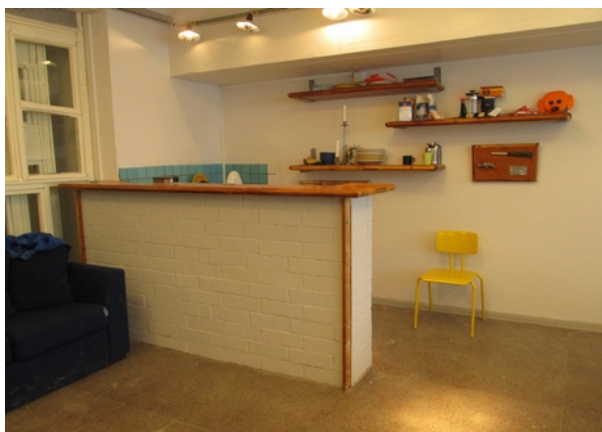
Taidekasarmin kierrätysmateriaaleista valmistunut sosiaalitila. Osa puretuista elokuvateatterin penkeistä löysi uuden tarkoituksen hyllyinä ja pöytätasoina.

Ars-Häme ry:llä oli ollut vuodesta 2010 lähtien vuokrattuna taiteilijoiden työhuoneiksi muodostunut Taidekasarmi. Vuokrataso oli hyvin kohtuullinen ja sellaisena se haluttiin pitääkin. Mutta tiloissa ei ollut edes yhteistä sosiaalitilaa, jossa ruokailla tai kokousta yhdessä vaan ainoat vesipisteet olivat vessoissa. Tekemätöntä työtä näkyi joka puolella, mutta talkootyölläkin alkoi olla jo rajansa vastassa. Karu