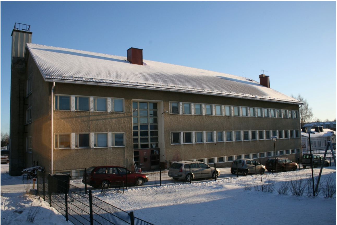
Taidekasarmi on vanha miehistökasarmirakennus Hämeenlinnan Poltinaholla. Taidekasarmi on toiminut vuodesta 2004 lähtien ja on esimerkki kollektiivista, joka on syntynyt taiteilijoiden omasta aktiivisuudesta.

Ars-Häme ry:llä oli ollut vuodesta 2010 lähtien vuokrattuna taiteilijoiden työhuoneiksi muodostunut Taidekasarmi. Vuokrataso oli hyvin kohtuullinen ja sellaisena se haluttiin pitääkin. Mutta tiloissa ei ollut edes yhteistä sosiaalitilaa, jossa ruokailla tai kokousta yhdessä vaan ainoat vesipisteet olivat vessoissa. Tekemätöntä työtä näkyi joka puolella, mutta talkootyölläkin alkoi olla jo rajansa vastassa. Karu