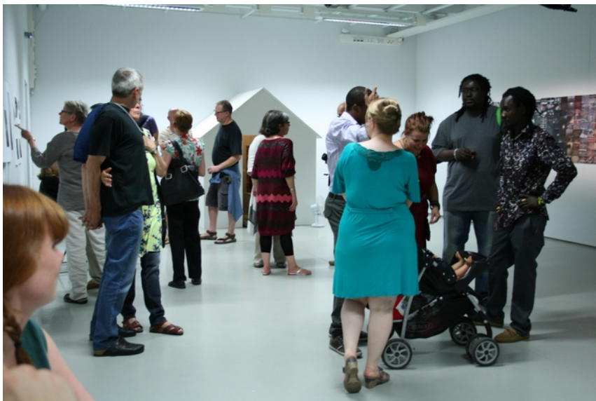
Maku-näyttelyn avajaiset heinäkuussa 2014 keräsivät monista eri kansalaisuuksista kutsuvieraita yhteen.

Yksi olennainen ongelmakohta oli kuitenkin se, että emme osanneet jäsentää selkeästi taiteilijan ja taiteen paikkaa sosiaalisesti sitoutuneessa työssä. Lähdimme yhteistoiminnallisesti ja toimintatutkimuksellisesti orientoituneena käymään läpi näitä ongelmakohtia pienen kuvataiteilijaryhmän ja opintovapaalla olevan toiminnanjohtajan kanssa asiaa. Tästä syntyi aluksi idea Tekemätön työ tehdyksi -hankkeesta.