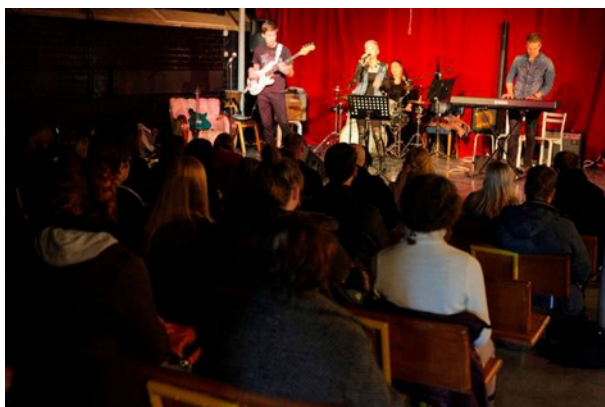
Taidekasarmin elokuvateatterissa saivat mm. kaupunginteatterin vanhat näyttämöverhot uuden elämän. Kuva avoimista ovista 2.11.2014.

Kuoma-hankkeen tuoman mallin sisäistämisen esteenä oli se, että emme osanneet selkeästi määritellä itsellemme ja ilmaista sitä, mikä on taiteen ja taiteilijan paikka monialaisessa työssä. Vuoden 2014 hanke opetti käytännössä meille kaikille, mitä sosiaalisesti sitoutunut taidetoiminta oikein on ja mitä monialainen yhteistyö vaatii. Missä itse taide on, siihenkin aloimme jo löytää viitteitä mm. dialogisen estetiikan esimerkeistä.