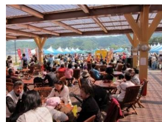
ながはま特設市に関する詳しい内容はホームページをご参照ください ( http://izutaga.jp/ )