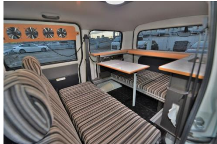
ダイネットモード