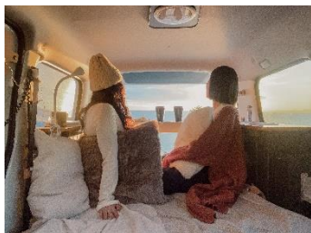
友人との卒業旅行