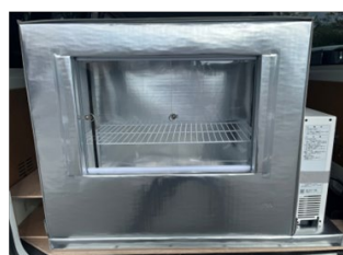
可搬式冷凍冷蔵機 (D-mobico/デンソー社) ※保冷ボックスはクラックス社となります