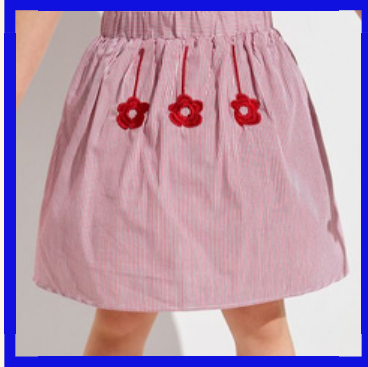
JUPE CERCLE ENFANT