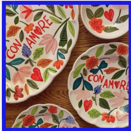
PEINTURE SUR ASSIETTES