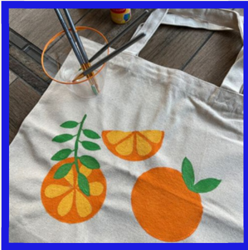
PEINTURE SUR TOTE BAG