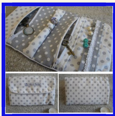
TROUSSE A BIJOUX