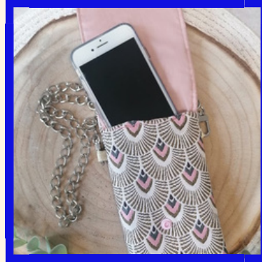
POCHETTE DE TELEPHONE