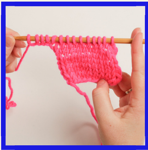
BASES DU TRICOT