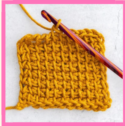
BASES DU CROCHET