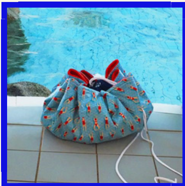
PIEDS À SEC