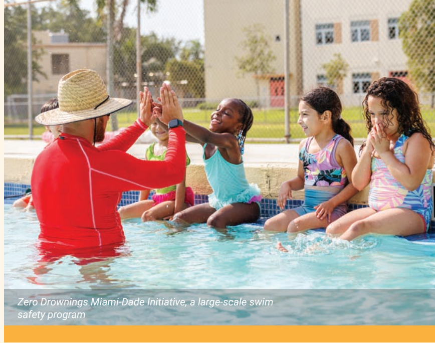
Zero Drownings Miami-Dade Initiative, a large-scale swim safety program

apèl nan 211 te reponn pa pèsònèl ki gen konpasyon