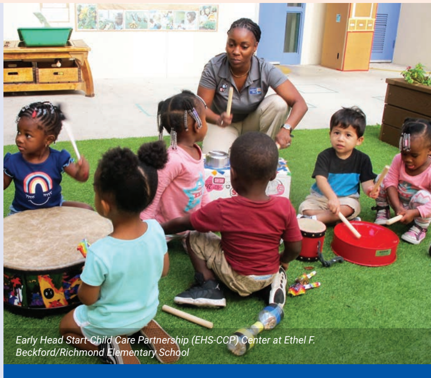
Early Head Start-Child Care Partnership (EHS-CCP) Center at Ethel F. Beckford/Richmond Elementary School

timoun piti te resevwa bon jan edikasyon an bonè