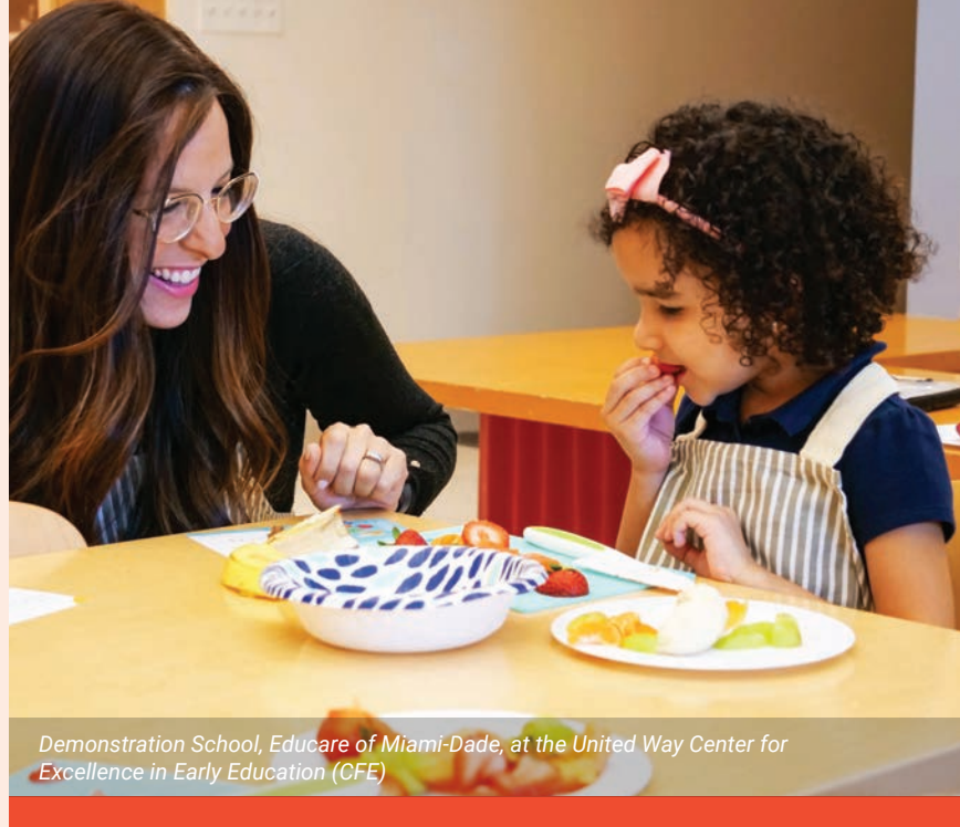
Demonstration School, Educare of Miami-Dade, at the United Way Center for Excellence in Early Education (CFE)

moun te gen aksè a sèvis sante ak byennèt