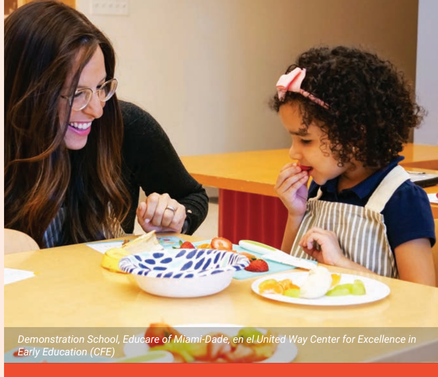
Demonstration School, Educare of Miami-Dade, en el United Way Center for Excellence in Early Education (CFE)

personas accedieron a servicios de salud y bienestar