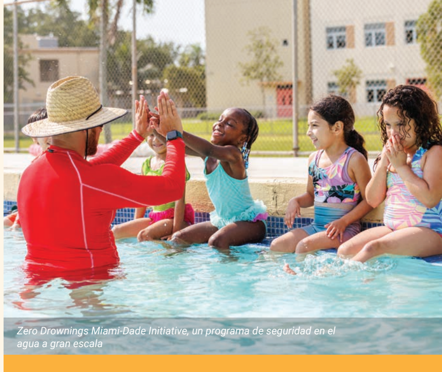
Zero Drownings Miami-Dade Initiative, un programa de seguridad en el agua a gran escala

llamadas al 211 fueron respondidas por personal compasivo