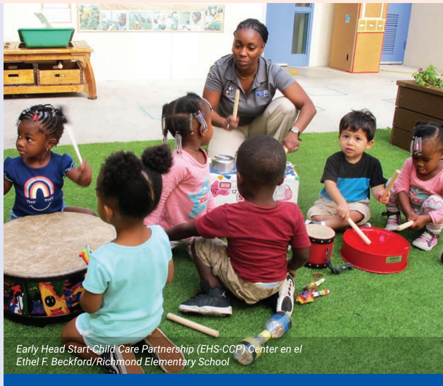
Early Head Start Child Care Partnership (EHS-CCP) Center en el Ethel F. Beckford/Richmond Elementary School

niños pequeños recibieron educación temprana de calidad