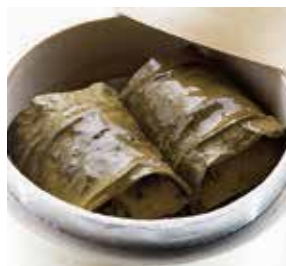
香椿荷葉飯 Lotus Leaf Sticky Rice Roll | 香椿おこわのハスの葉包み | NTD 98