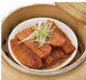
XO醬金錢肚 Braised King Oyster Mushrooms with XO Sauce | エリンギのXOソース蒸し | NTD 128