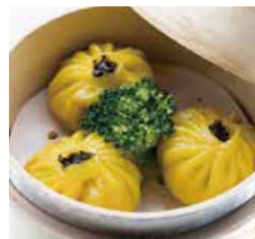
牛肝蕈南瓜果 Steamed Pumpkin Dumpling with Porcini | ポルチーニとカボチャ入り蒸し餃子 | NTD 108