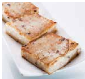
香煎蘿蔔糕 Pan Fried Turnip Cake | 大根餅 | NTD 68