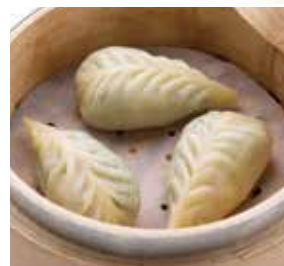
小棠蒸素餃 Steamed Vegetarian Dumpling | チンゲン菜入り蒸し餃子 | NTD 98