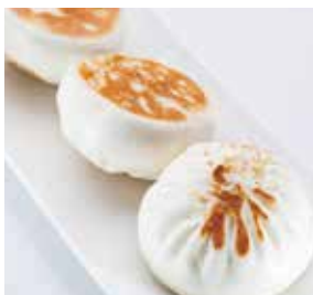
香煎五丁包 Pan Fried Five-Dice Bun | 具次山焼きまんじゅう | NTD 128