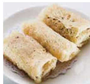
脆皮炸糕渣 Deep Fried Gaojha Roll | サクサク揚げ餅 | NTD 98