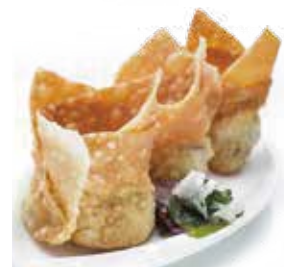
塔香金雲吞 Deep Fried Wonton with Basil and Vegetables | バジルと野菜入り揚げワンタン | NTD 108