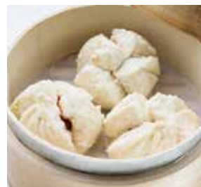
蜜汁叉燒包 Cantonese Barbecued Vege Ham Bun | チャーシューボー | NTD 98