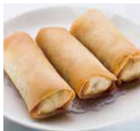
養心炸春捲 Deep Fried Spring Roll | 春巻き | NTD 98