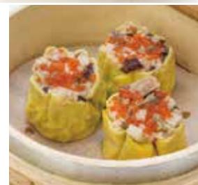
翠玉燒賣 Tribute Vegetable Shao Mai | 山くらげシュウマイ | NTD 108