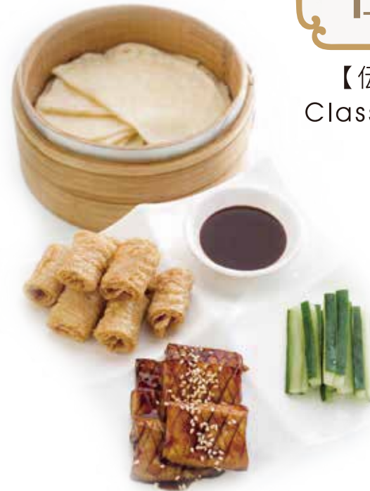
京味醬燒杏菇(帶餅)

以上價格均需另加10%服務費 All prices are subjected to a 10% service charge 上記の料金に10%のサービス料が加算されます