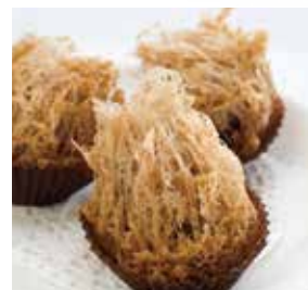
蜂巢芋頭角 Deep Fried Taro Dumplings | タロイモ揚げ餃子 | NTD 108