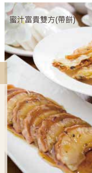
蜜汁富貴雙方(帶餅)