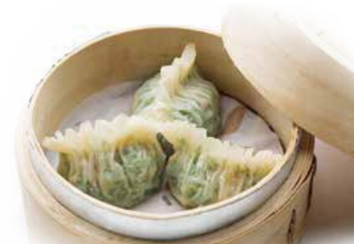
Steamed Dumplings with Vegetables and Mushrooms | 野菜ときのこ入り蒸し餃子 | NTD 108