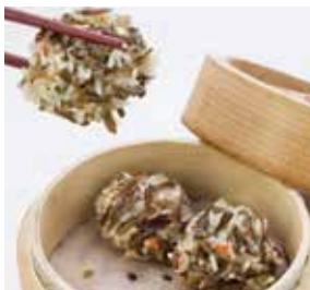
野米珍珠丸 Mixed Veggie Chinese Pearl Balls | もち米団子 | NTD 98