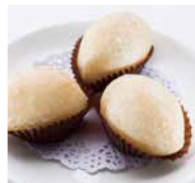
家鄉鹹水角 Deep Fried Stuffed Mushroom Dumpling | キノコ入り揚げギョーザ | NTD 98