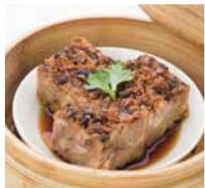
香茜芋頭糕 Taro Cake | 蒸したロイモ餅 | NTD 98