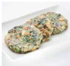
雪菜煎薄餅 Pickled Mustard Greens and Vegetables Pancakes | 雪菜の中華風チヂミ | NTD 98