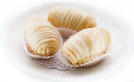
Deep Fried Pastry with Shredded Turnip | 千切り大根のパイ包み | NTD 108