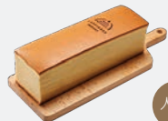
B6. 日式經典蜂蜜蛋糕