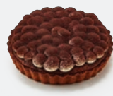
Q18. 香蕉巧克力布蕾派