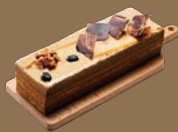
B13. 日式卡布芙心布蕾