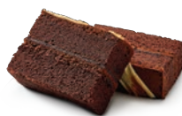
Q3. 黑星星松露巧克力