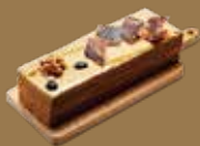
B13. 日式卡布芙心布蕾