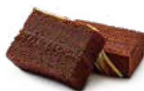
Q3. 黑星星松露巧克力