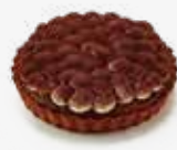
Q18. 香蕉巧克力布蕾派