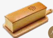
B6. 日式經典蜂蜜蛋糕