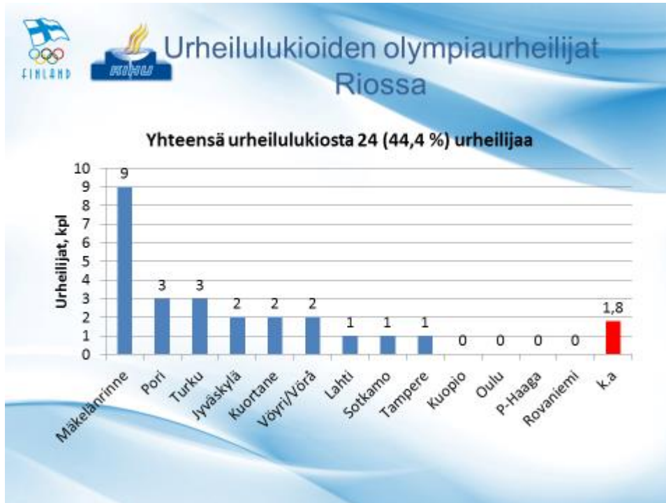
Liite 2. Valtakunnallinen urheiluakatemioiden ja valmennuskeskusten rakenne