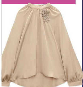
Soepelvallende satijnen top met kraaltjesapplicaties €39,95 Zara

Weekend geeft wijnpakketten De Drie van Dries weg. Wilt u kans maken op dit heerlijke wijnpakket met daarin drie rode en drie witte wijnen die Dries zelf zorgvuldig geproefd en geselecteerd heeft? Ga dan naar de Facebook- of Instagrampagina van Weekend en volg daar de instructies.