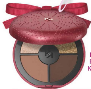
Joyful Holiday Bright Dream Eyeshadow Palette van Kiko Milano. €16,99