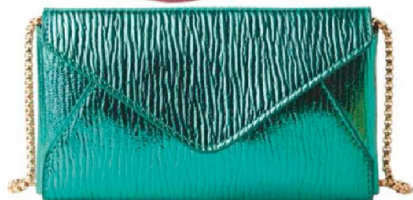
Voor een feestelijk avondje: Crossbody bag van Costes. €25,-