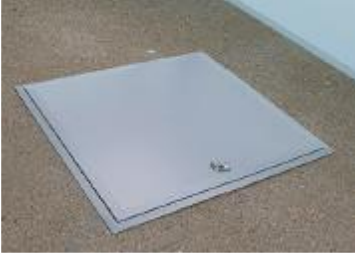
Kuva 1. Luukku parvekkeen lattiassa