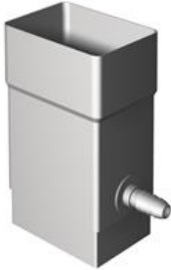
Kuva 1. K7 x 10 vesirosvo