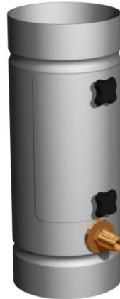
Kuva 2. P10 vesirosvo