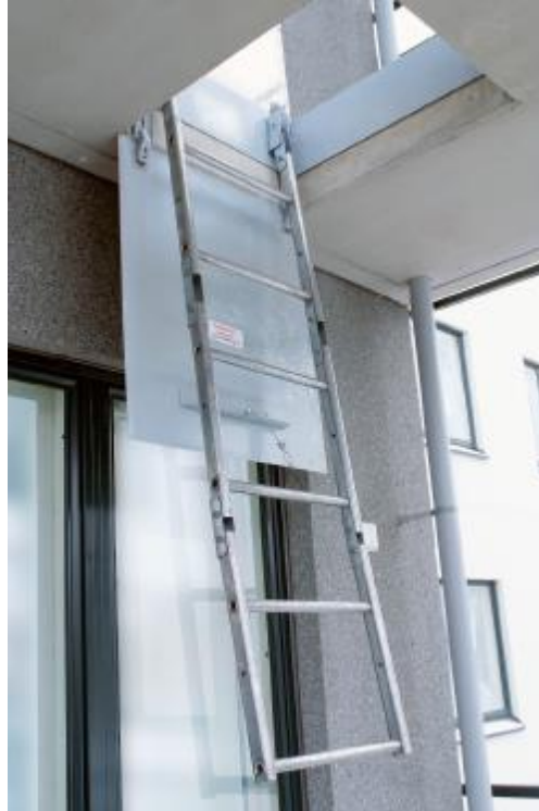
Kuva 4. Luukku avattuna