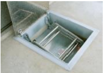
Kuva 2. Luukku sisältä