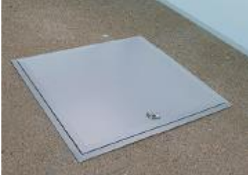
Kuva 1. Luukku parvekkeen lattiassa