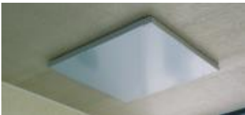
Kuva 3. Alakansi parvekkeen katossa