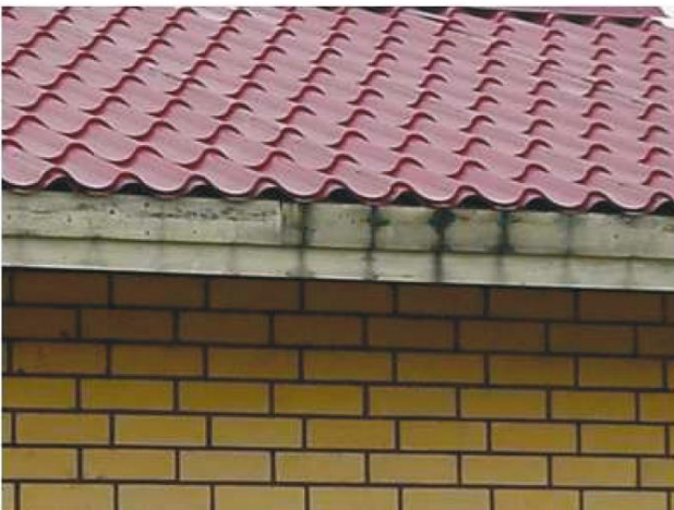
Kuva 2. Valuva vesi on jättänyt mustat raidat otsalautaan ja lahottanut sen.

Kevyellä sateella veden pintajännitys kääntää vesipisarat tiilen tai pellin tippanokasta takaviistoon kohti otsalautaa ja sopivalla sademäärällä suoraan otsalautaa kohden. Vesivekin tippalista on suunniteltu suojaamaan rakenteita ja ohjaamaan tämä vesikouruun, sen sijaan että valuva vesi vaurioittaisi otsalautoja. Ongelman voi havaita esimerkiksi mustista raidoista otsalautoissa. Tippalistan käyttöä suositellaan kaikkiin kattotyyppeihin.