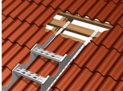
Kuva 2. Tiilikatto