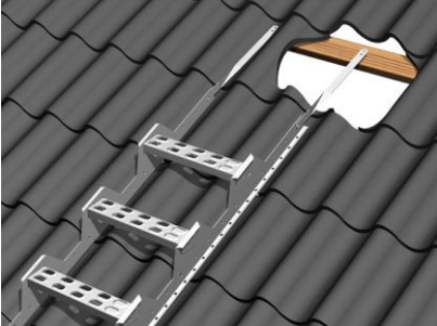
Kuva 1. Pelti- ja huopakatto