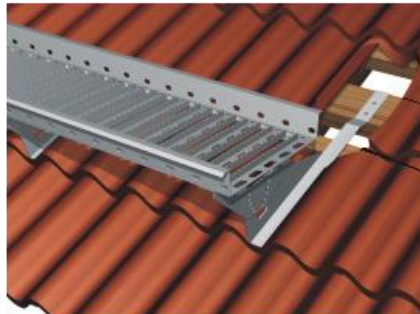
Kuva 2. Tiilikatto