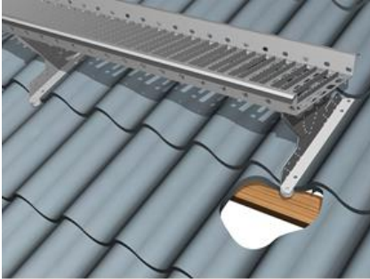
Kuva 1. Pelti- ja huopakatto