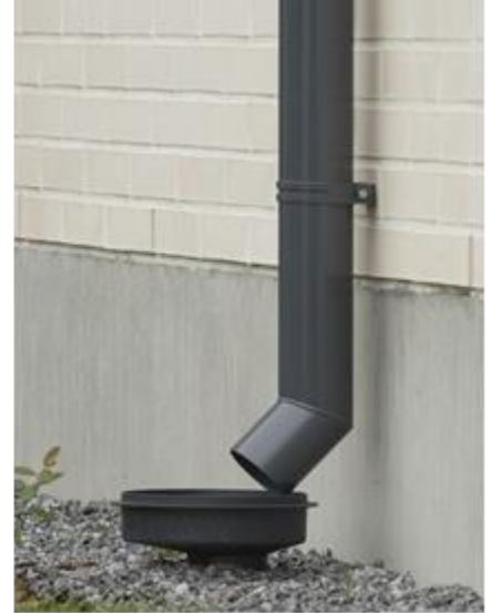
Kuva 1. Havainnekuvat