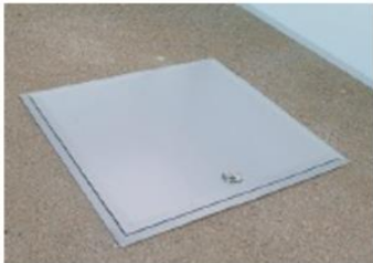
Luuk rõdu põrandas