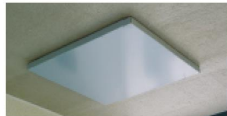
Nedre lock i taket på balkongen