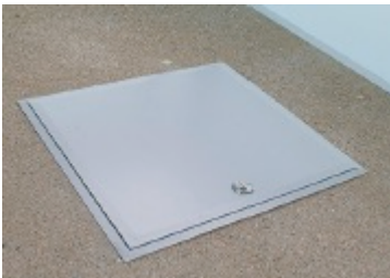
Luukku parvekkeen lattiassa