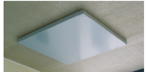
Alakansi parvekkeen katossa