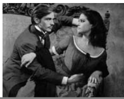
Associazione The Thing

Grazie al digitale abbiamo subito approfittato di questa stupenda opportunità che la Fondazione Cineteca di Bologna ha voluto creare. Le uscite sono mensili e il primo film ad arrivare in sala è Il delitto perfetto (Dial M for Murder) nella sua versione originale in 3D, esattamente come lo aveva concepito il Maestro del brivido. Dopo il capolavoro di Alfred Hitchcock, la rassegna prosegue a fine ottobre il Gattopardo di Luchino Visconti.