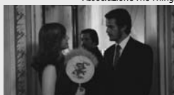
Associazione The Thing

trato su classici del fado, dello choro e pezzi originali del duo. Il progetto del fado è rendere omaggio alla tradizione galpista portoghese, poco conosciuta ed eseguita in Italia, ed accostarla a generi popolari sudamericani, quali il tango e lo choro brasiliano. Alla base di questa unione sta la volontà di infrangere confini spaziali e rivendicare un comune sentire che unisce l'area mediterranea a quella latino americana.