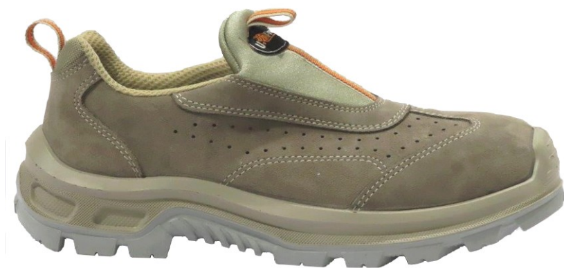
FOTO SUOLA PHOTO OF OUTSOLE