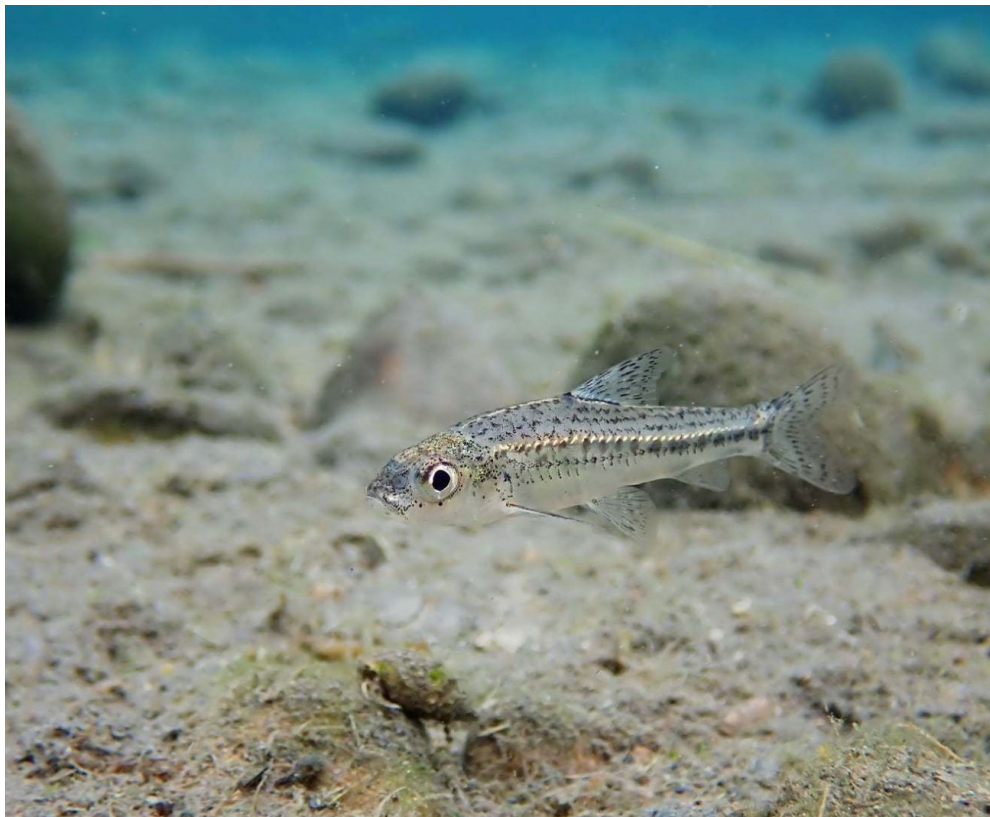
巴氏銀鮎。